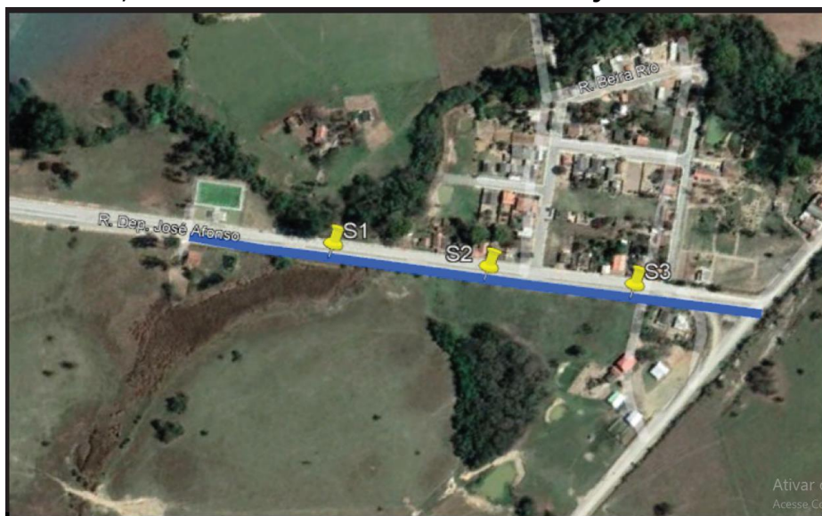
Locação dos pontos

Levando-se em consideração que a solução, considerou-se parcial a extensão a ser substituída/acrescida, em função das características do material encontrado, alta expansão. No entanto, devido a inexecuibilidade de prever na totalidade o reconhecimento total do subleito, sendo este identificados totalmente quando na execução da obra, fica estabelecido que: Caso encontre pontos no subleito com CBR igual ou superior 6% e expansão \geq 2\% , necessitará ser feito a substituição nestes locais.