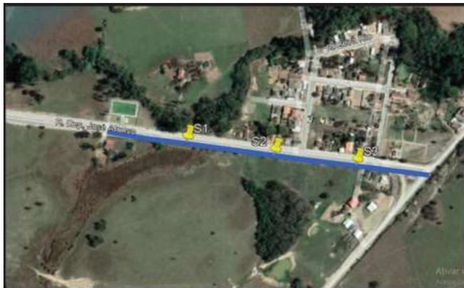
Locação dos pontos

Serão executadas manualmente as pequenas regularizações e escavações para o assentamento da pavimentação das “Lajotas Sextavadas”.